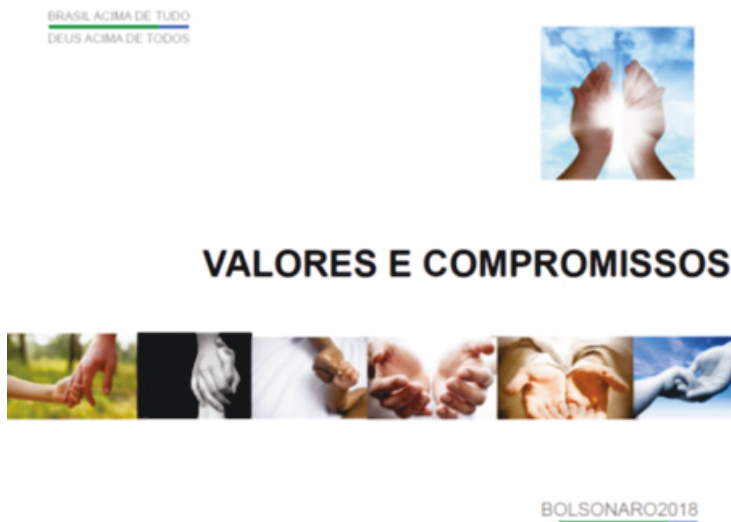
Imagem 1.2. Página introdutória do capítulo “Valores e Compromissos do programa eleitoral de Bolsonaro (2018).

No entanto, o programa de Bolsonaro (2018) contém mais ofertas de identificação religiosa. O primeiro capítulo do programa intitulado “Valores e Compromissos” é acompanhado por uma iconografia comum de grupos religiosos na base de apoio de Bolsonaro: